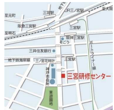
三宮研修センター 神戸市中央区八幡通4丁目2-12

*福祉用具の取り扱い方などについて、ご希望やご質問などあればご記入下さい。セミナーの中で取り上げていきます。